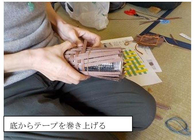
底からテープを巻き上げる