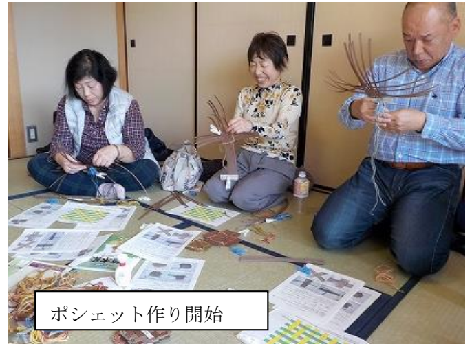
ポシェット作り開始