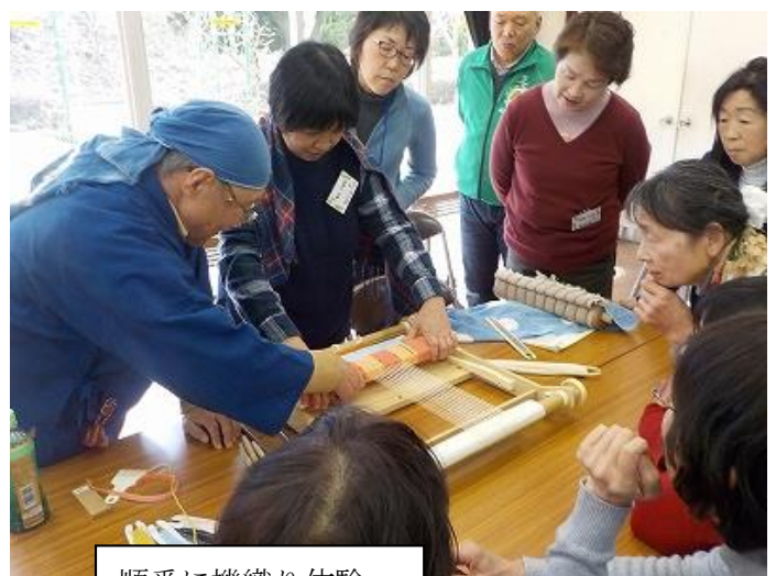
順番に機織り体験