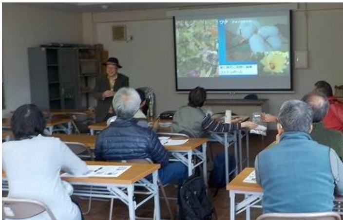
スライドで機織り講義