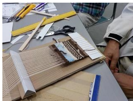
難しい模様 to 苦戦