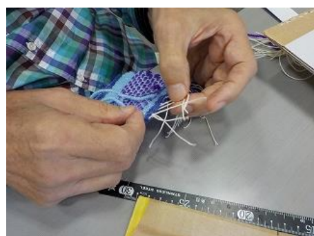
布端を1本取りで結ぶ