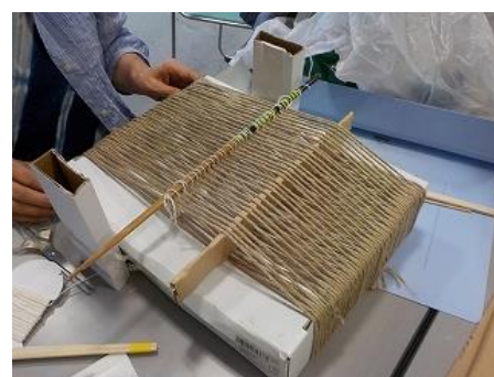
綜統付き織機開発中